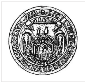
Vilniaus Chirurgų Draugija