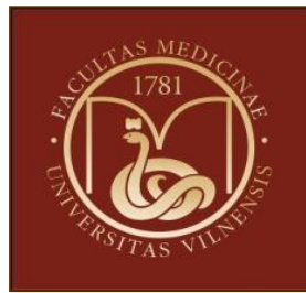
Vilniaus universiteto Medicinos fakultetas